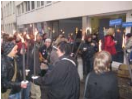
8. März 2009 - Demonstration zum Internationalen Frauentag »Feuer und Flamme für Frauenrechte«