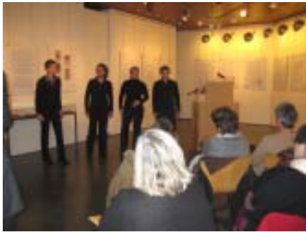
14. Januar 2009 - Eröffnung der Ausstellung »90 Jahre Frauenwahlrecht. Frauen im Mainzer Stadtrat« mit der Acapella-Gruppe Good Vibrations