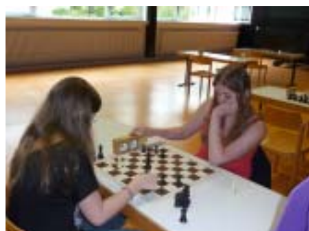
12. und 13. September 2009 - 7. Mainzer Mädchenschachturnier