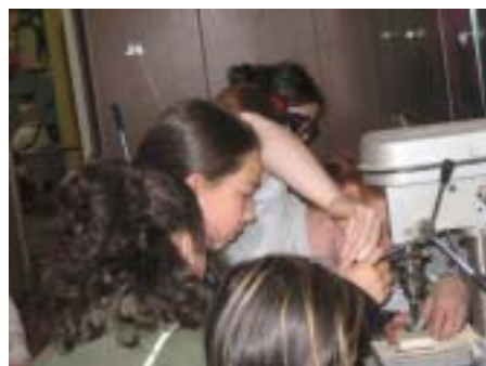
23. April 2009 - Girls' Day 2009 im Neustadtzentrum