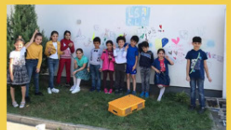
Arabisch Sprachkurs für geflüchtete Kinder

Inhaltlich und bildrechtlich verantwortlich ist ausschließlich die sich vorstellende Organisation.