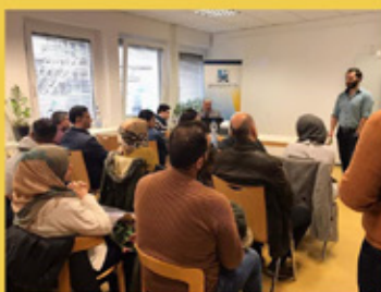
Seminar: Kindererziehung zwischen Schule und Zuhause