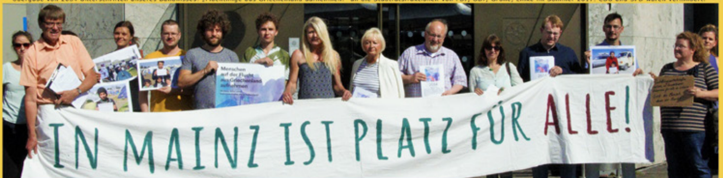
Übergabe von 2084 Unterschriften unseres Bündnisses: „Flüchtlinge aus Griechenland aufnehmen!“ an die Stadtratsfraktionen von FDP, ÖDP, Grüne, Linke im Sommer 2017. CDU und SPD waren verhindert.

Inhaltlich und bildrechtlich verantwortlich ist ausschließlich die sich vorstellende Organisation.