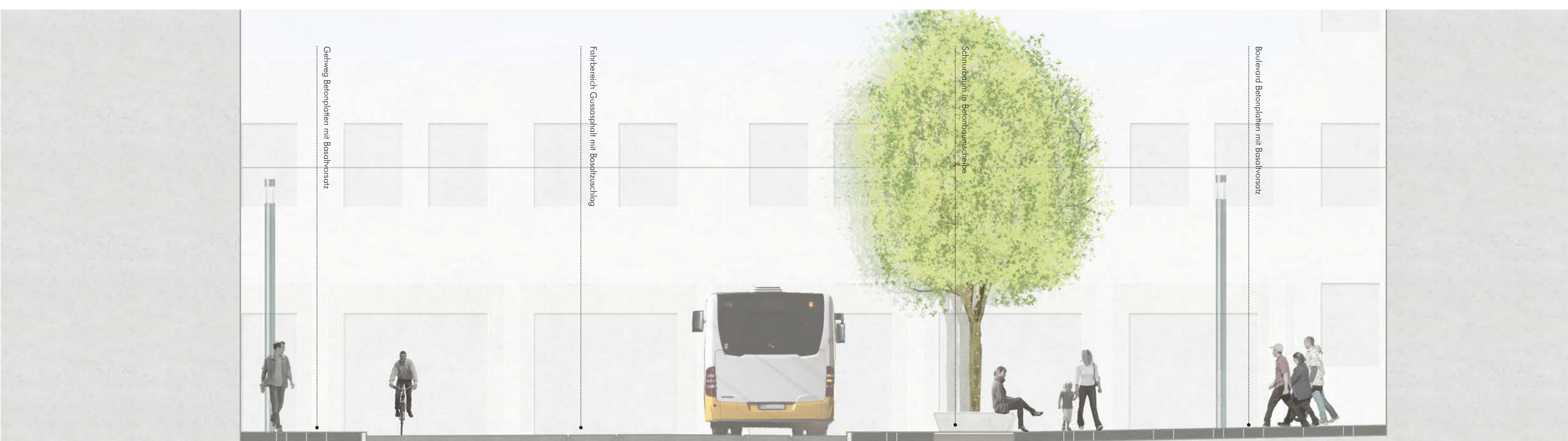
Schnitt CC Schillerstraße M 1:50