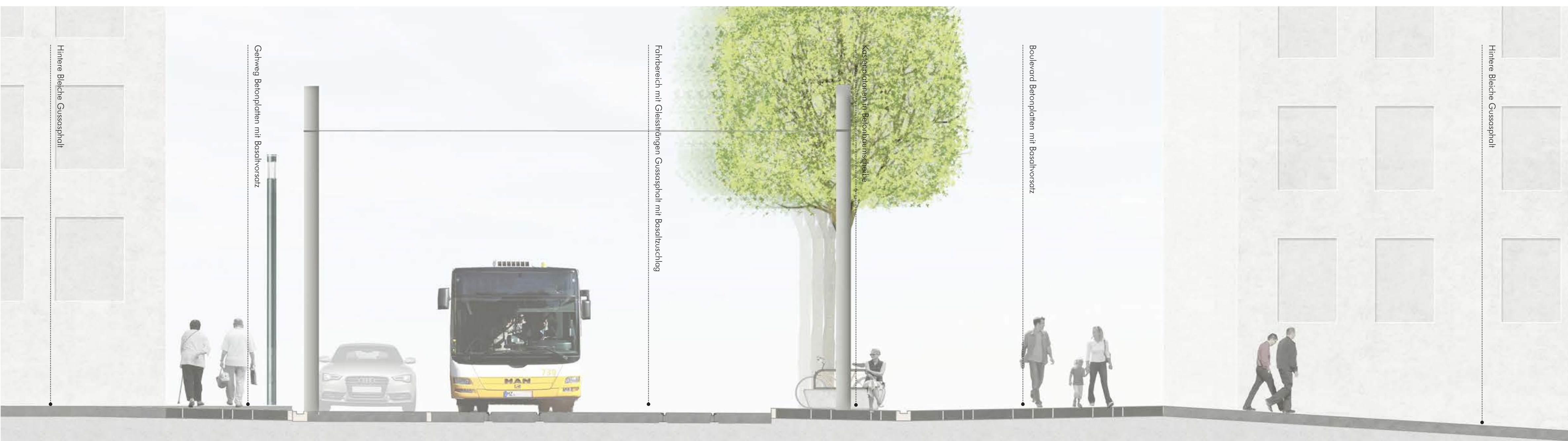
Schnitt AA Bahnhofstraße M 1:50