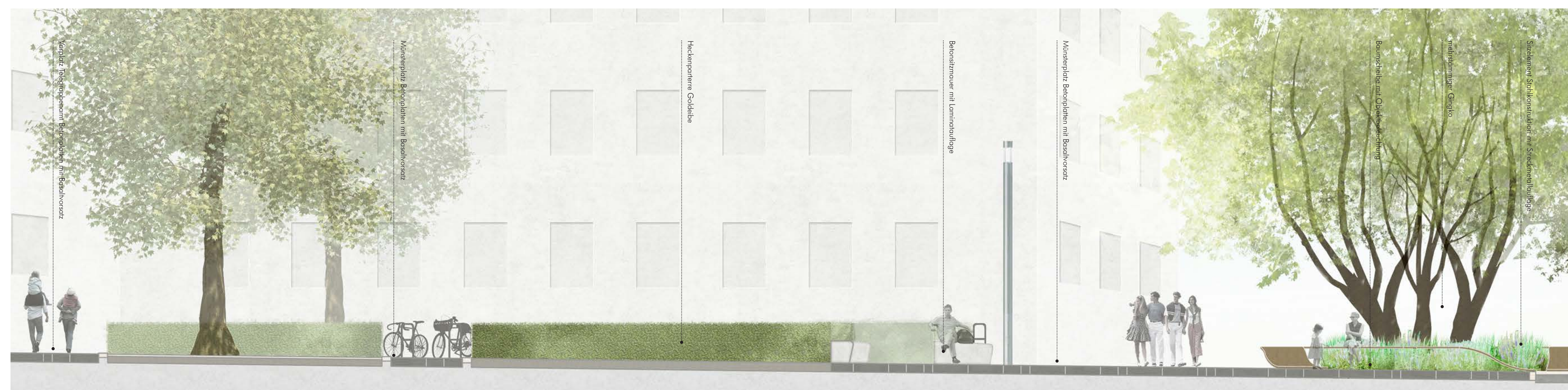
Schnitt BB Münsterplatz M 1:50

Die notwendige Beleuchtung basiert durchgängig auf der Verwendung der einfachen, aber modular vielseitig rüstbaren Stelenleuchte des Schillerplatzes (Lichtpunkthöhe 8,00m). Effektvolle Nachtansätze bestehen in der schwebenden Ebene des Daches der Warthalle und in den beleuchteten Vertikalen der Stämmen und Kronen des Geschwisterpaars Ginkgo.